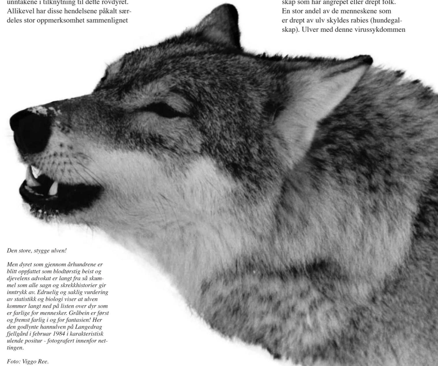
Den store, stygge ulven!

del av verden med stor ulvebestand, foreligger det noen få dokumenterte tilfeller om ulveangrep på mennesker. Noen av disse er fra de siste årene. Derimot finnes det flere beskrivelser av f.eks. rabiesbefengte dyr og individer i eller fra fangenskap som har angrepet eller drept folk. En stor andel av de menneskene som er drept av ulv skyldes rabies (hundegalskap). Ulver med denne virusykdommen